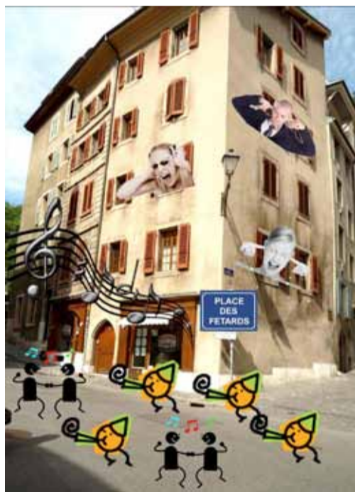
La mère royaume l'avait prédit : les fantômes des savoyards reviendront si l'on y prend pas garde!

Lasuite? Vous pouvez l'imaginer. Sinon, visitez notre blog http://crisedulogementgeneve.blogspot.com/ et suivez la trace de notre passage en enfer jusqu'à la rédemption tant attendue. Heureusement qu'à Genève, post tenebras lux! Thierry Gaillard